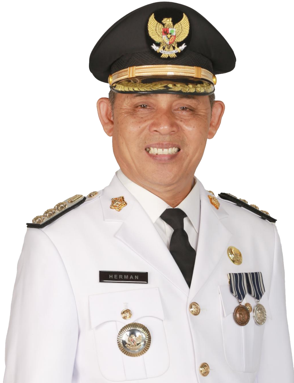
H. HERMAN PJ. BUPATI INDRAGIRI HILIR PERIODE NOVEMBER 2023 – JULI 2024