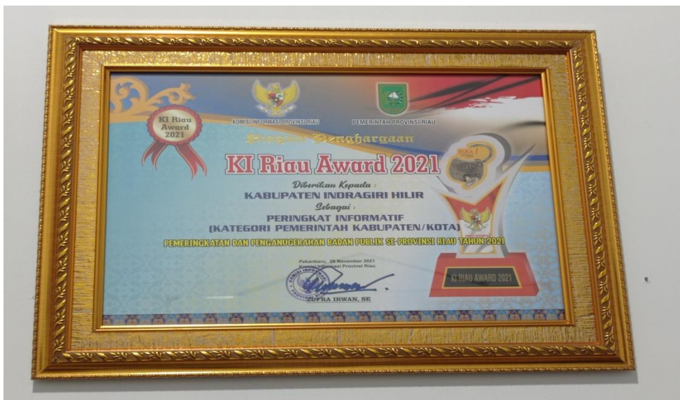
Piagam Penghargaan KI Award 2021 diberikan oleh Kabupaten Indragiri Hilir sebagai Peringkat Informatif (Kategori Pemerintah Kabupaten/Kota) Peningkatan dan Penganugerahan Badan Publik Se- Provinsi Riau Tahun 2021.

Indikator Nilai Keterbukaan Informasi Kabupaten Indragiri Hilir pada tahun 2021 melebihi target yang telah ditetapkan. Berdasarkan penilaian Komisi Informasi (KI) Riau, Nilai Keterbukaan Informasi Kabupaten Indragiri Hilir adalah sebesar 97 dengan kategori Pemerintah Kabupaten/ Kota sebagai Peringkat Informatif.